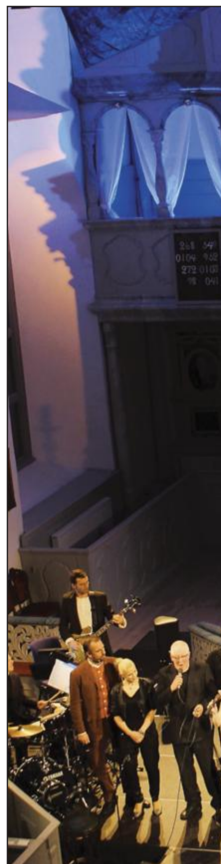
NYDELIG: Store artister og stort engasje