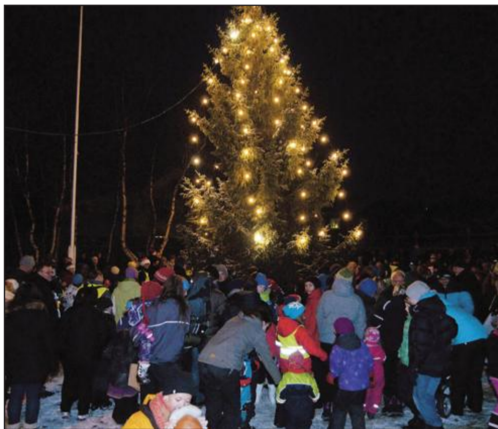
TENTE LYS: Mer enn 500 personer møtte opp for å få med seg julegrantenninga på Nilsenhjørnet.