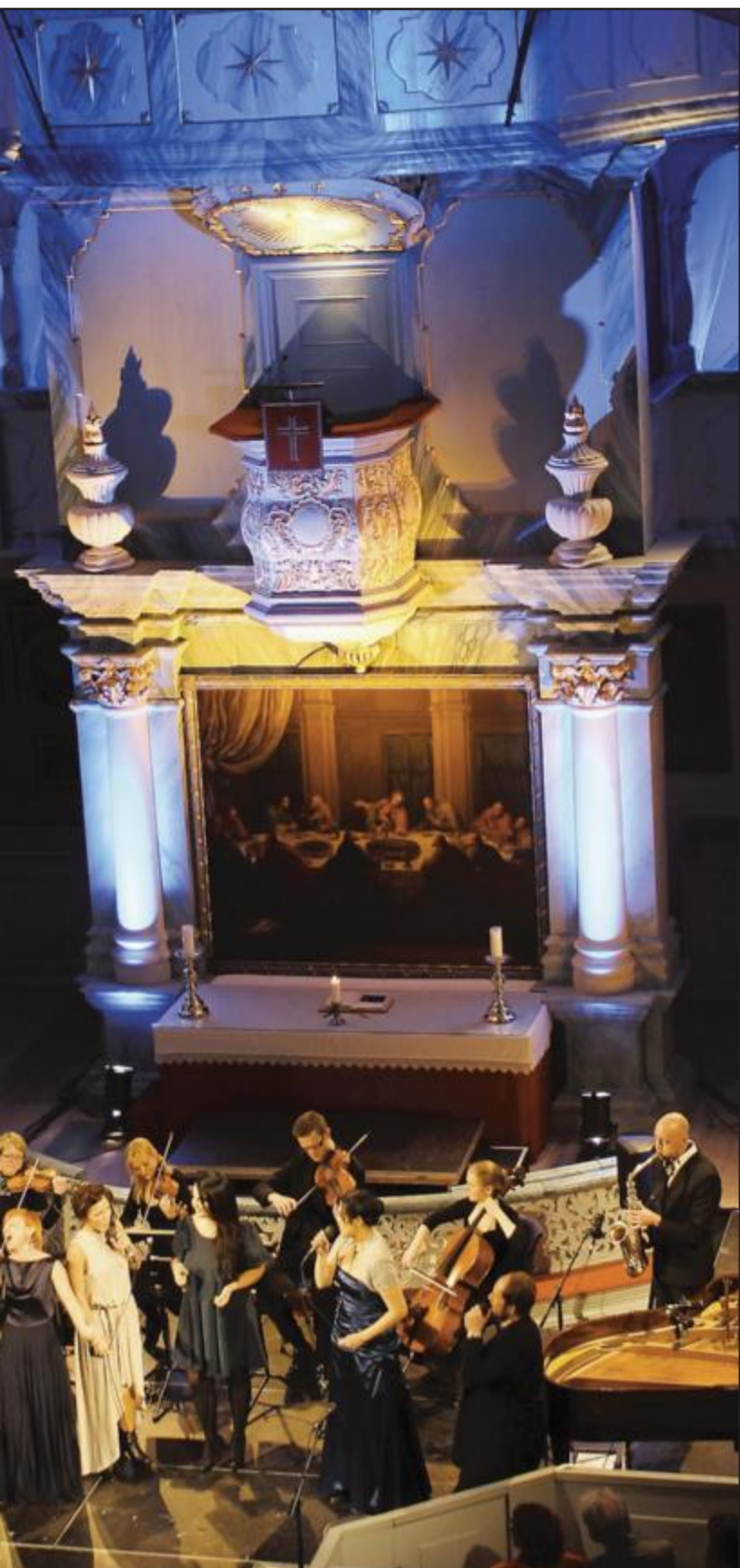
ment for verden i Røros kirke lørdag kveld.