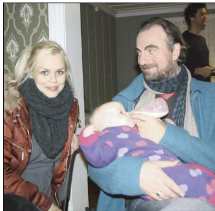
FAMILIELYKKE FOR SKUESPILLERPAR: Ylva på sju måneder får en matbit mens storesøster, Heine, 20 måneder, kviler i vogna utover om at hun kanskje blir Elden - stjerne neste år.

Elden, tar skrittet opp til daglig leder - funksjon og er allerede godt i gang med arbeidet.